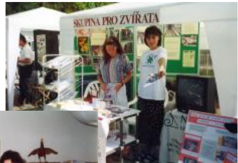
part of our team in 1999 at Czech national agro fair

Besides the farm animals protection, we have been active and successful in promoting alternatives to animal experiments in universities, and in humane education generally, (many materials are being distributed to schools and ecological NGOs), helping animals from cruelty, and other activities (see www.spolecnostprozvirata.cz and www.alternativeeducation.org ).