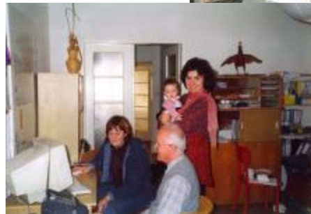
at one of our offices in 2001 and our increase by the baby

Besides the farm animals protection, we have been active and successful in promoting alternatives to animal experiments in universities, and in humane education generally, (many materials are being distributed to schools and ecological NGOs), helping animals from cruelty, and other activities (see www.spolecnostprozvirata.cz and www.alternativeeducation.org ).