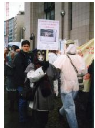
In 2003 we organized an international demonstration at the Czech-Polish crossing point of Český Těšín ; 55 participants from the Czech Republic, Slovakia and Poland.