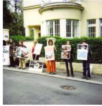
With media, in front of Italian Embassy and Brussels demos: