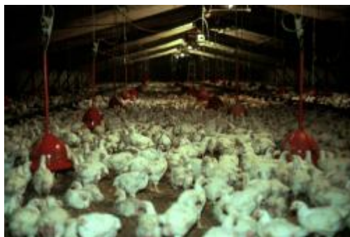
Intenzivní chov brojlerů ve Velké Británii