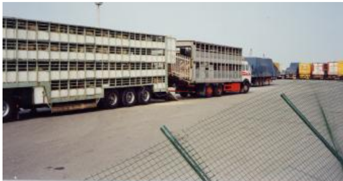
Přeprava britských ovcí