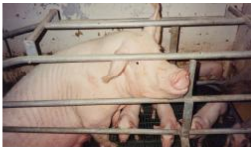
Prasnice v porodní kleci a intenzivní výkrm prasat

Veškeré vepřové maso, které nabízí pod svou značkou Waitrose a přes polovinu vepřového značky Co-op pochází z humánnějších venkovních chovů, kde nejsou prasnice umístěny v klecích. Navzdory ustanovení směrnice EU z roku 2003, aby prasata měla k dispozici manipulativní materiál jako je sláma a aby jim nebyly rutinně zkracovány ocásky, ukázal průzkum, že tato ustanovení nejsou dodržována. 80 % a více vepřového nabízeného všemi řetězci pochází z prasat jímž byly useknuté ocásky. Asi polovina vepřového z vykrmovaných selat a prasnic je od zvířat, která neměla k dispozici manipulativní materiál.