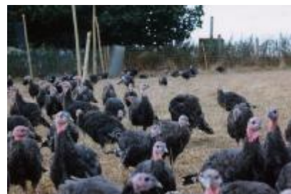
Intenzivní chov kachen, krocanů a volný chov krocanů, Velká Británie